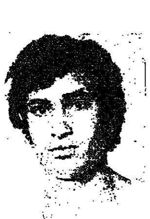
حملي عودة حمي المرعي